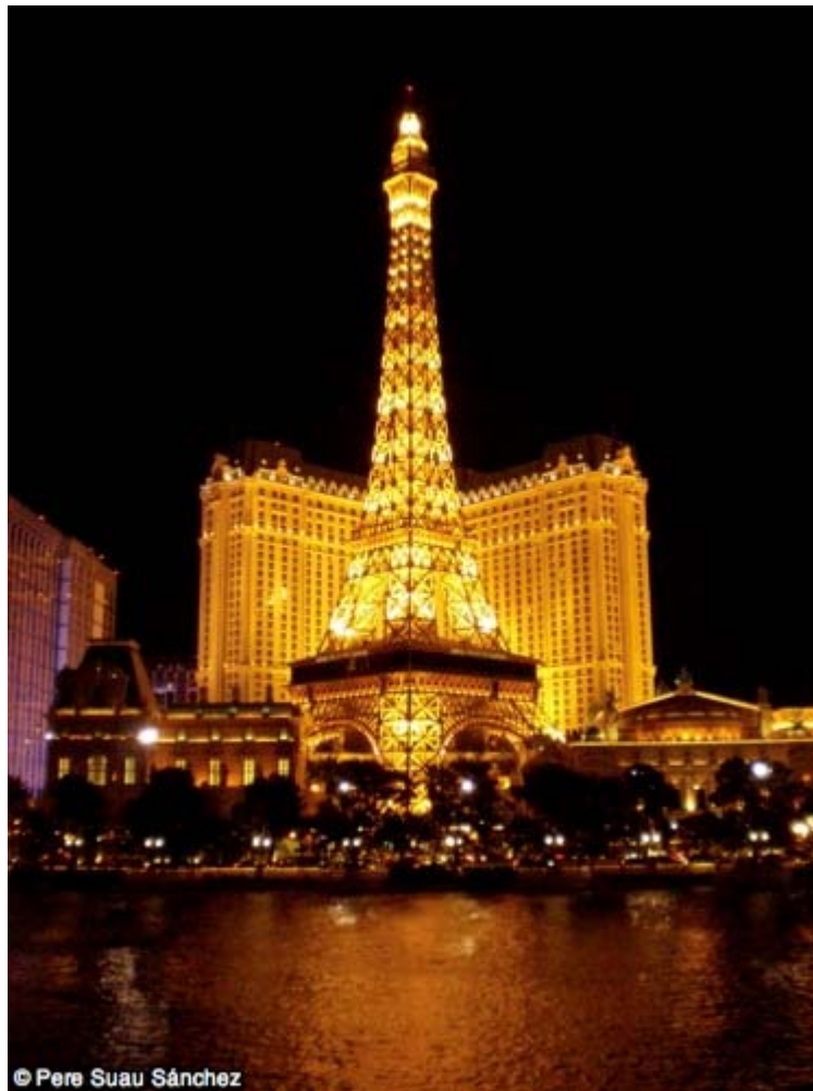
Torre Eiffel a Las Vegas.

temps i l'espai negant qualsevol tipus d'herència històrico-geogràfica local. Las Vegas és un gran aparador on les fites són els rètols lluminosos i la transacció comercial l'única funció possible.