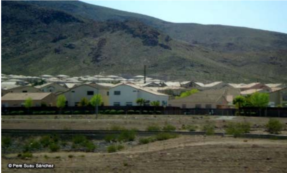
Gated Community a Las Vegas.

Sense voler entrar, encara, a parlar de la seva possible localització, sí que pertoca aquí un breu comentari sobre les implicacions territorials de l'EuroVegas. I és que un complex especialitzat, desconectat de qualsevol trama urbana i amb el vehicle privat com a mode d'accés principal, contradiria de forma clara els " Criteris per al desenvolupament del Programa de planejament territorial " [R] que es recolza en els principis bàsics de la compacitat, la complexitat i la cohesió [6] i que té com a repte redreçar la situació de nombrosos sectors residencials i comercials de baixa densitat. Un EuroVegas aïllat i desconectat en forma i funció de la realitat urbana metropolitana refutaria el mateix Decret llei 1/2009 d'ordenació dels equipaments comercials [S], (modificat en el marc de la Llei Omnibus) fruit de la transposició de la Directiva Europea de Serveis a la normativa comercial catalana, que pretén preservar el model de comerç urbà de proximitat basat en la cohesió social i l'equilibri territorial. Una norma que dictamina que la implantació de noves superfícies comercials es faci sempre dins la trama urbana consolidada dels municipis.